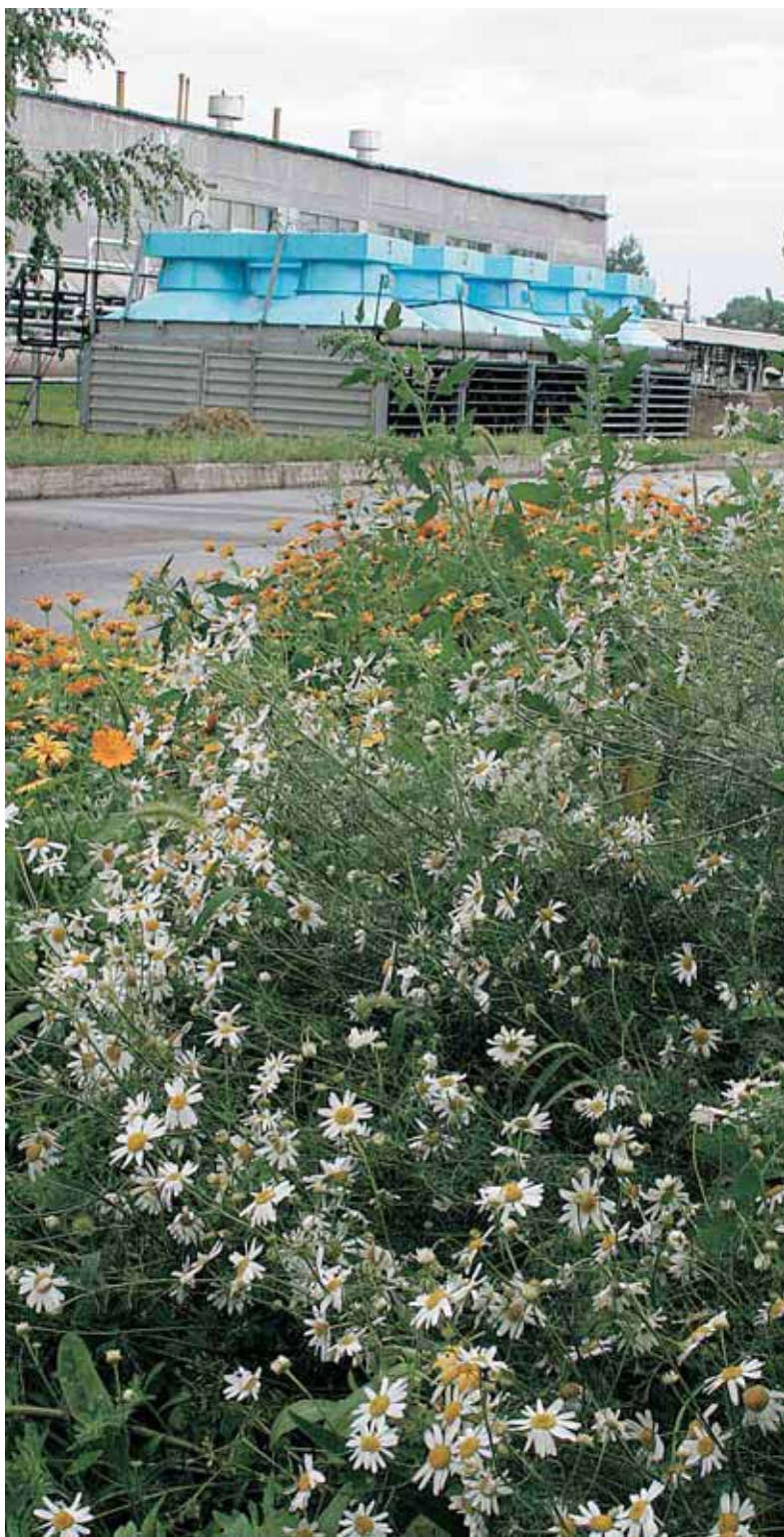
▼ Территория Юргинского ЛПУ МГ