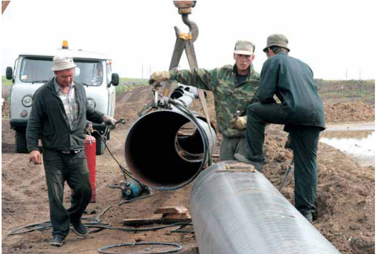
▲ Капитальный ремонт на газопроводе-отводе «Юрга – Новосибирск»