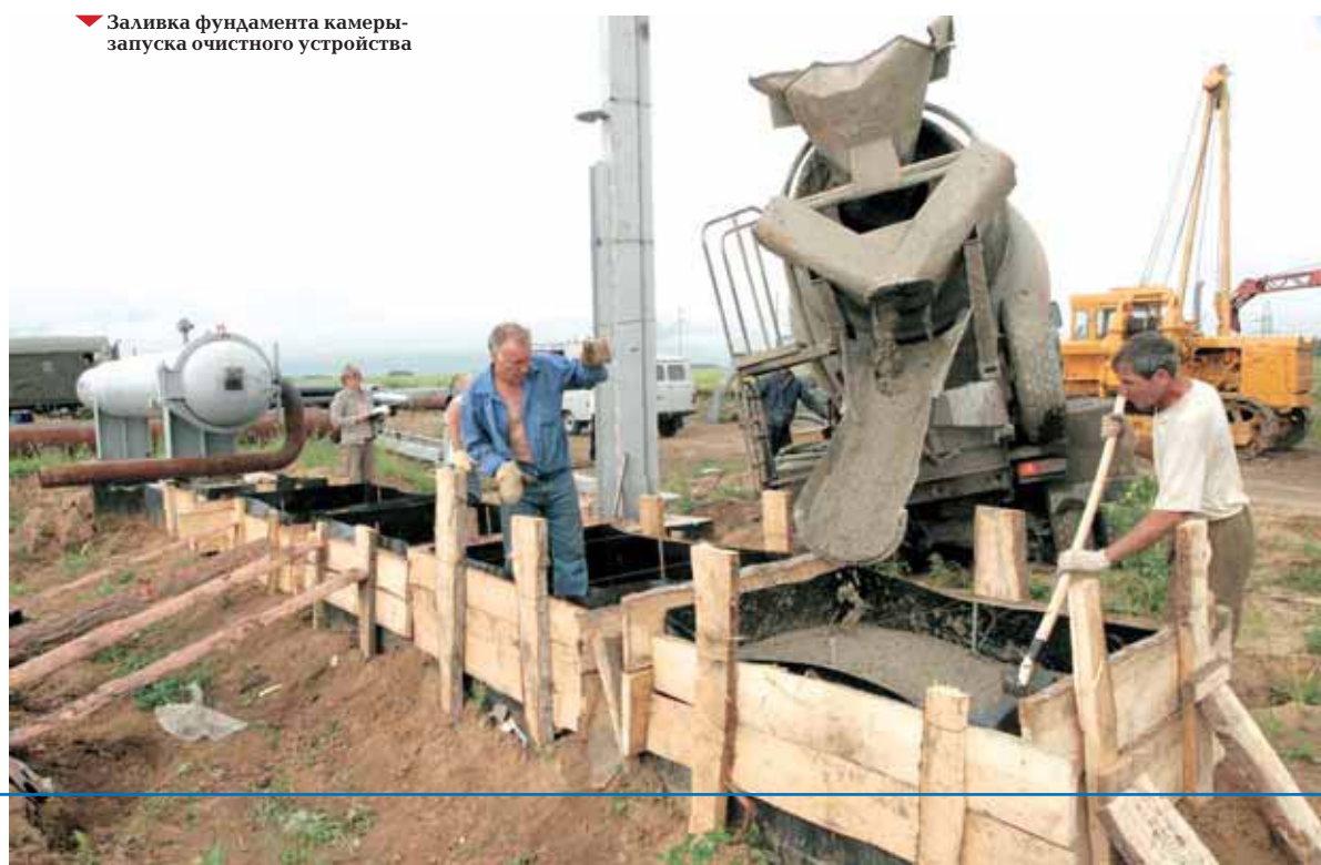
▼ Заливка фундамента камеры запуска очистного устройства

- Безусловно! — ответил он. — Вот, к примеру, станция 361 километра. Можно чуть повысить напряжение до двух вольт, что и делаем, — следует цепь ма-