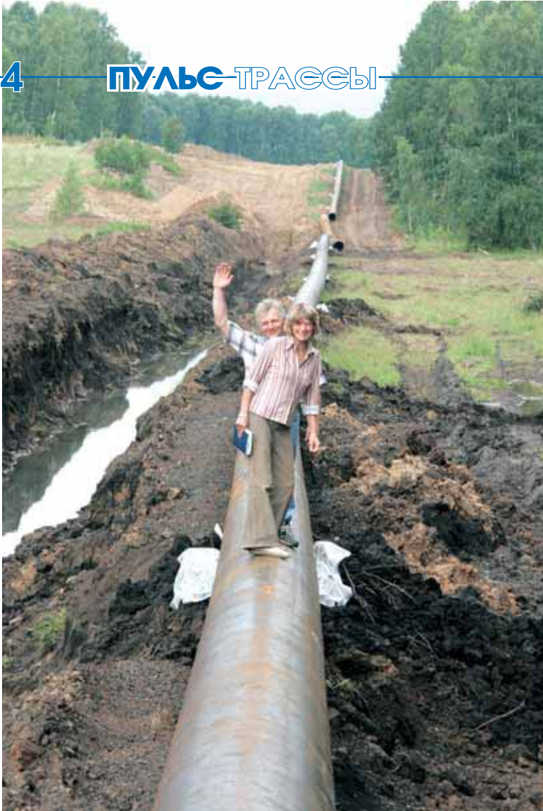
▲ По трубе, как по канату

Помню свою первую командировку в Юргинское ЛПУ. Тогда только стартовала акция «Наш Томсктрансгаз». Детям, чьи родители работают в Обществе, предлагалось нарисовать то, каким они видят это большое, технологичное, серьезное предприятие, обеспечивающее газом шесть областей Сибири. А художнику, как известно, нужна натура. Как изобразить то, о чем не имеешь ни малейшего представления, или оно слишком туманно?