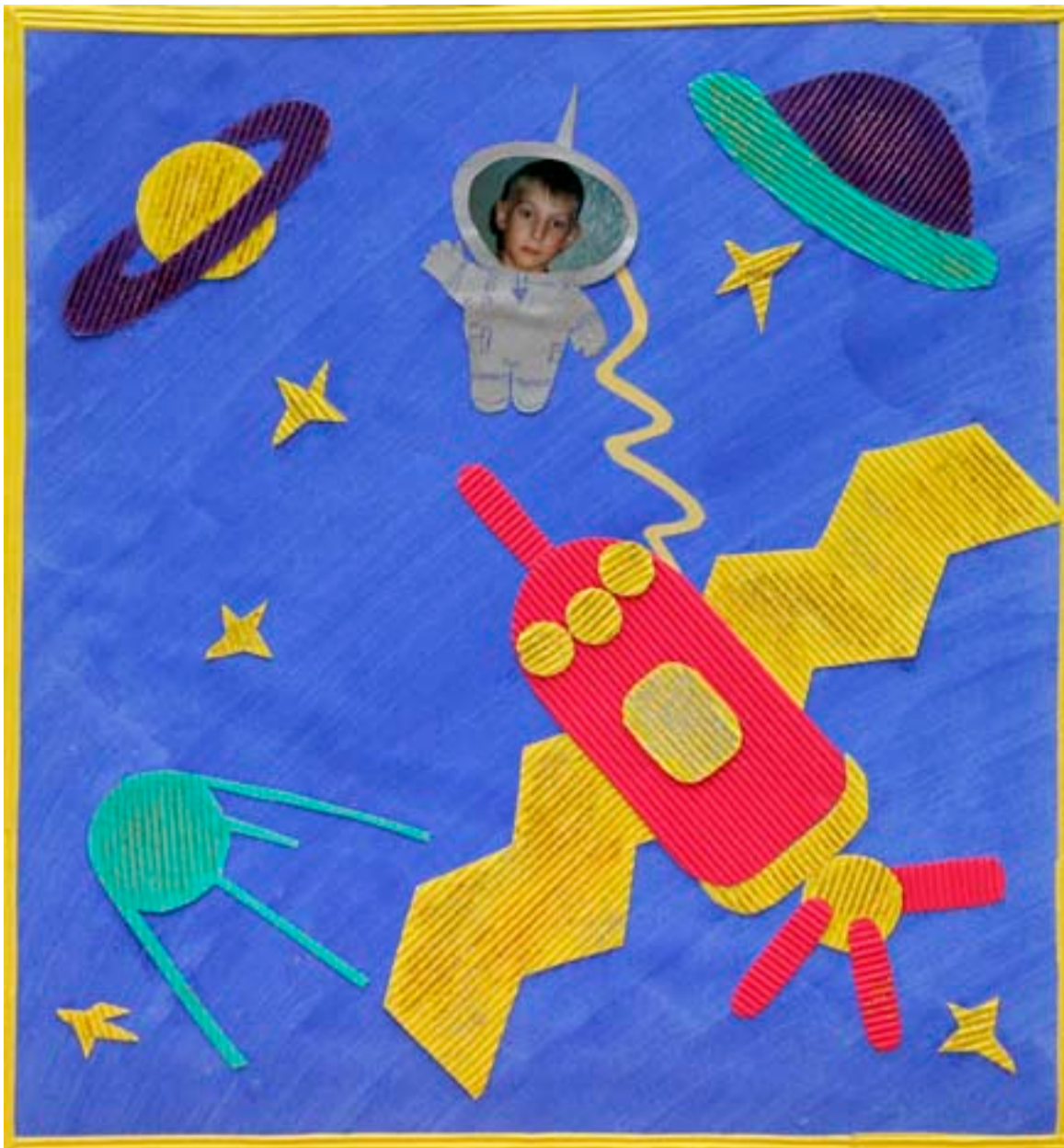
Навстречу фестивалю «Мечты сбудутся. К 30-летию Томсктрансгаза» был объявлен конкурс детского творчества. Публикуем часть присланных работ. Ждём следующего взлёта вашей фантазии!

Такая вот работа у королевы газовых колонок.