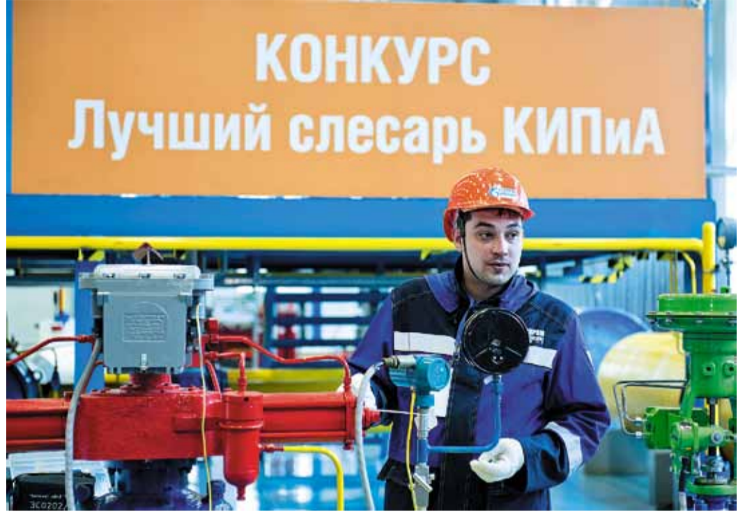
Для специалистов КИПиА конкурс – это форма повышения своей квалификации