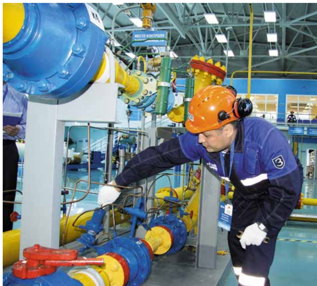
На полигоне Корпоративного института отработывали задания операторы ГРС