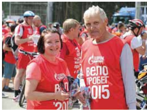
Пенсионеры Общества – всегда в строю!