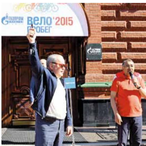
На старт! Внимание! Марш!

щим испытанием. Для соблюдения норм безопасности здесь колонну переформировали – по четыре человека в ряд.