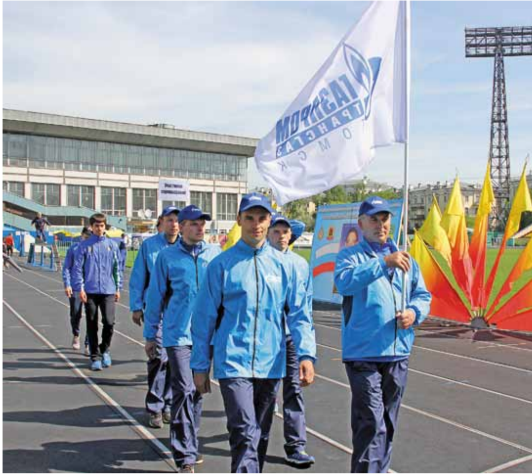
Парад участников конкурса

143 участника из 36 субъектов Российской Федерации приехали в Новокузнецк, чтобы определить лучших пожарных страны. Торжественным парадом они прошли по дорожкам центральной арены города – стадиона «Металлург». И среди них впервые гордо маршировала колонна «Газпром трансгаз Томск».