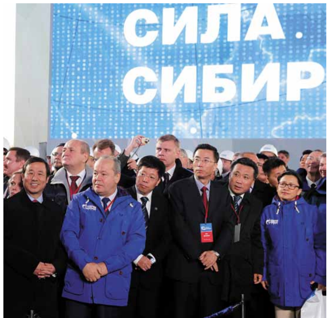
1 сентября в Якутске был дан старт проекту «Сила Сибири»