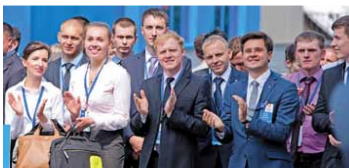
Это наша молодежь!