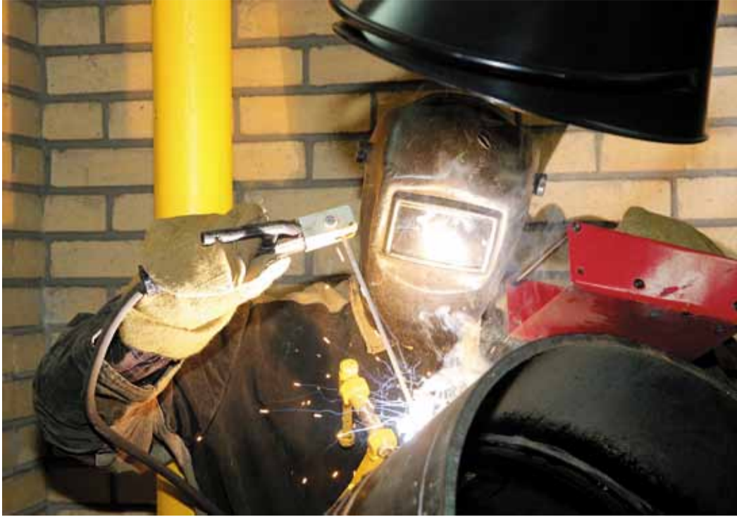
Сварщик – одна из главных профессий газовой отрасли