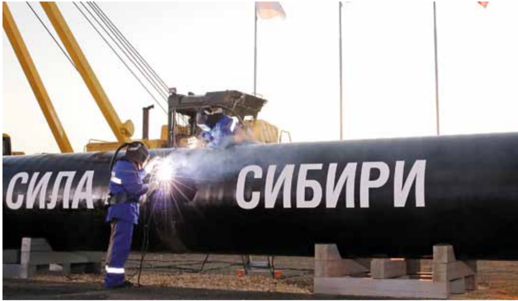
Сварка первого стыка «Силы Сибири»

Проведенные работы позволяют говорить о надежной защите объектов технологической связи от коррозии, что обеспечивает безаварийную работу всей технологической связи. Данные работы осуществлялись в соответствии с утвержденным Планом капитального ремонта объектов связи основных фондов ООО «Газпром трансгаз Томск» на 2015 год. ■