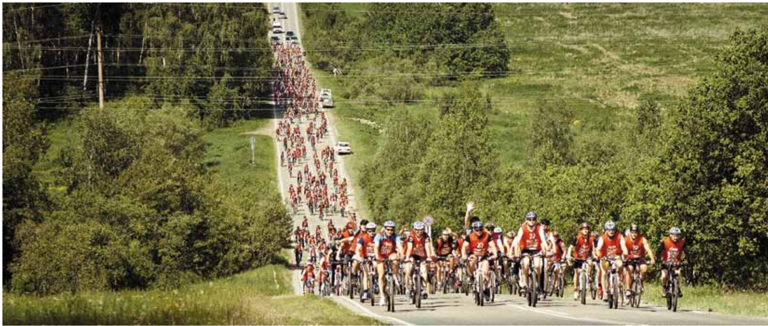
Солнце на спицах, синева над головой

Спуск по Мокрушинскому «серпантину» на скорости около 40 километров в час для неопытных велосипедистов оказался настоя-