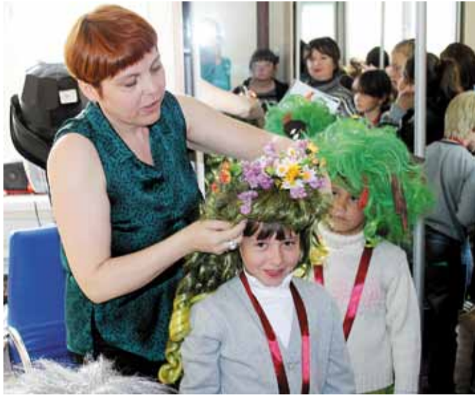
Разноцветный праздник для детворы Сахалина

А при помощи газовиков Томского ЛПУМГ дети из подшефного Моряковского детского дома посетили спектакль «Дядя Федор, Кот и Пес» в Театре драмы. Для детей вы-