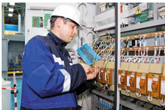
Конкурс электромонтеров по обслуживанию электрооборудования