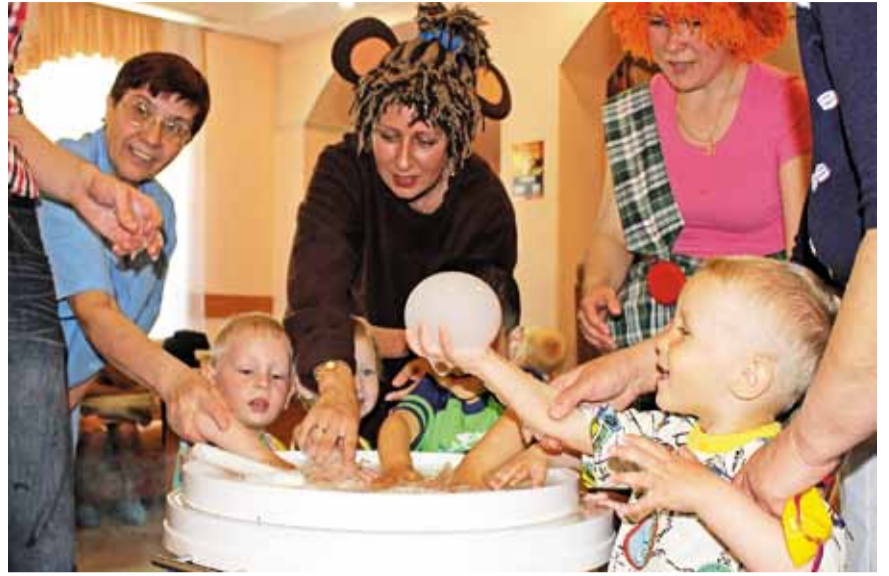
Мыльные пузыри – своими руками