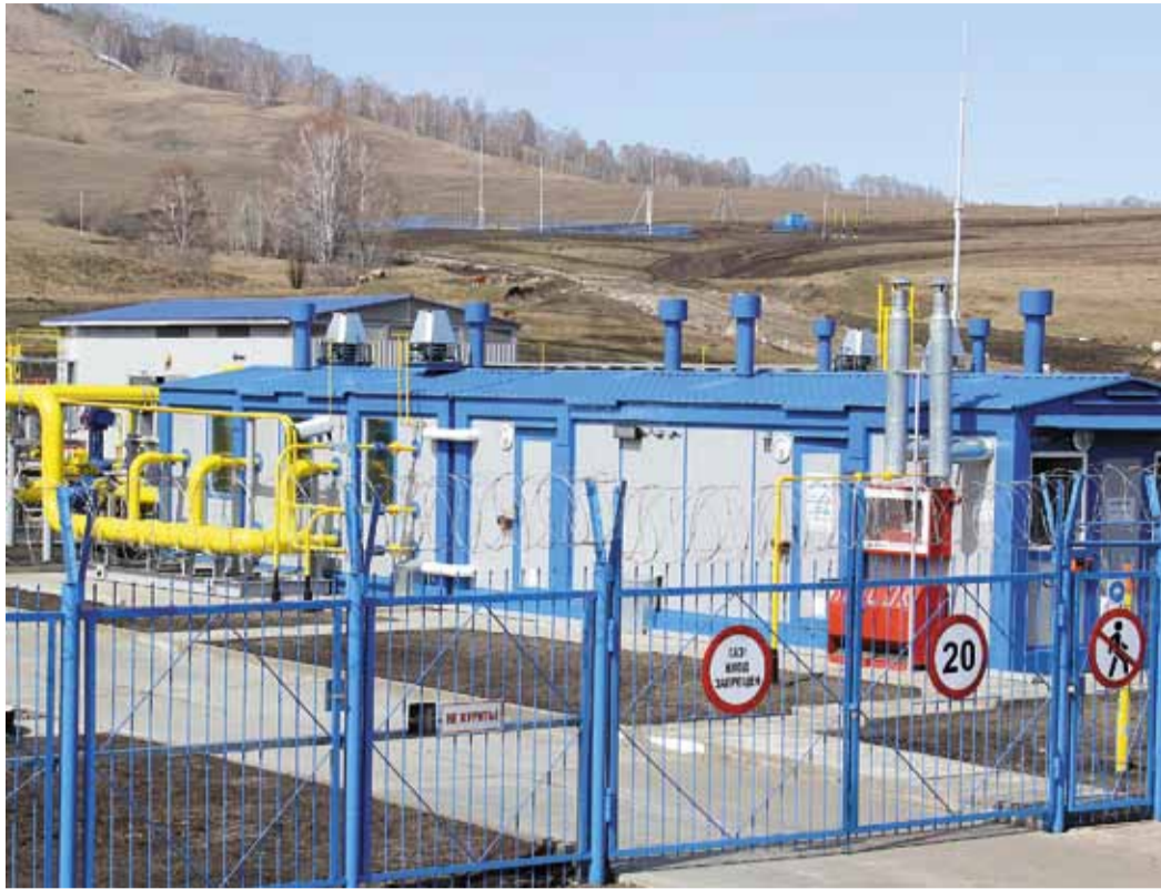
Такими станут ГРС после капитального ремонта. На снимке — ГРС «Нежнекаянча» (Алтайское ЛПУМГ)