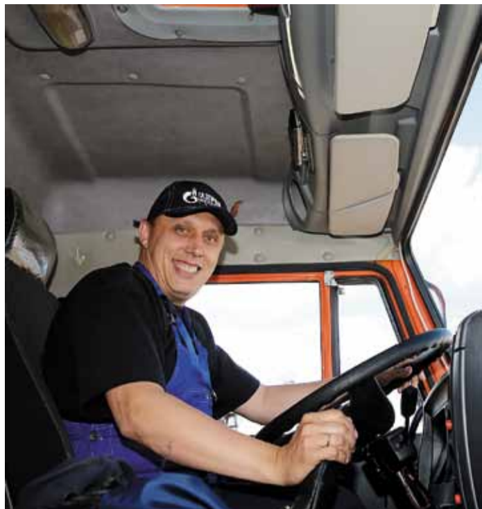
Водитель – профессия ответственная