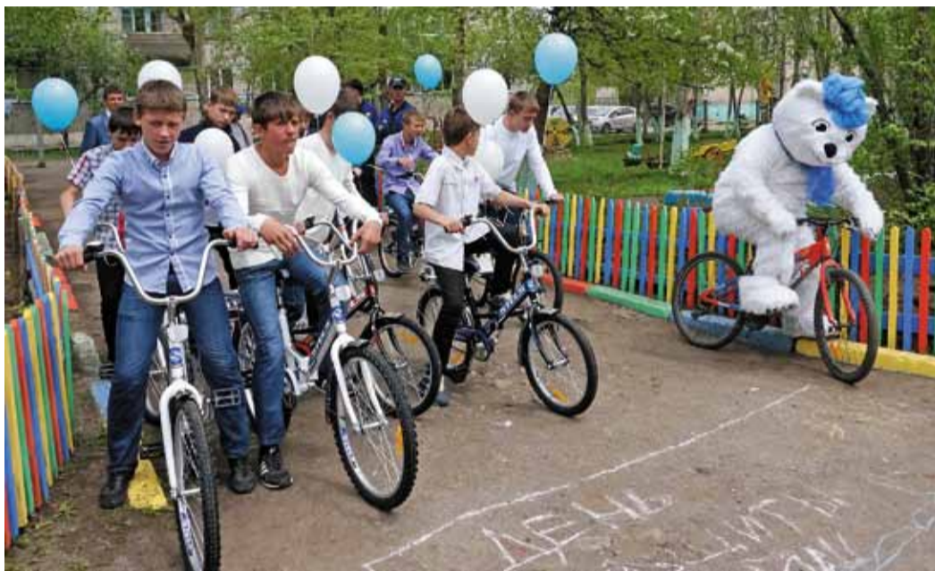
Что может быть лучше нового велосипеда?