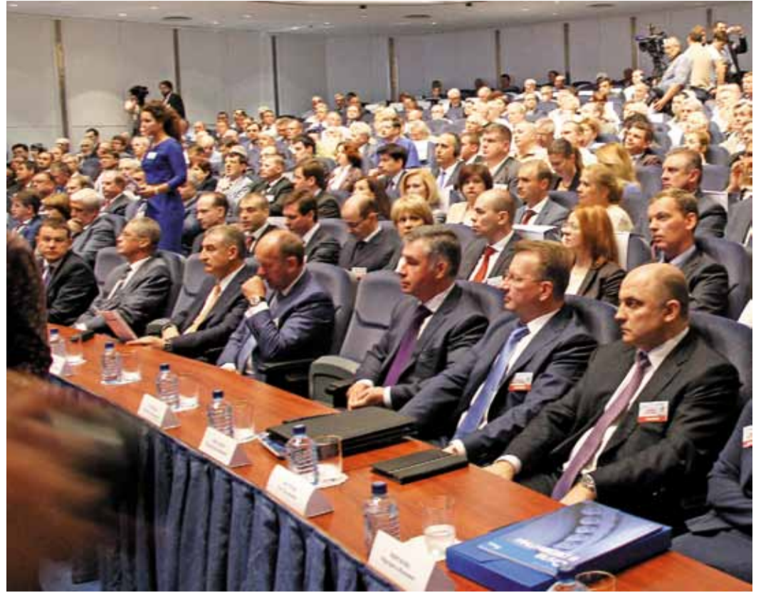
Доклад Председателя Правления А.Б. Миллера был выслушан с особым вниманием

Совместная работа с Shell заслуживает особых слов. С этой компанией мы подписали соглашение о стратегическом партнерстве. Потенциал нашего сотрудничества после слияния Shell с BG Group значительно расширился. Мы намерены углублять наше взаимодействие и вести работу по всей цепочке создания стоимости в газовой отрасли: от разведки и добычи до переработки и маркетинга, используя схему обмена активами. Такая модель работы позволит партнерам обеспечить дополнительную маржу и распределение рисков. Газпром лидирует в области трубопроводного транспорта, Shell – лидер в индустрии СПГ. Сжиженный природный газ позволит нам выйти на новые, недоступные для трубопроводно-