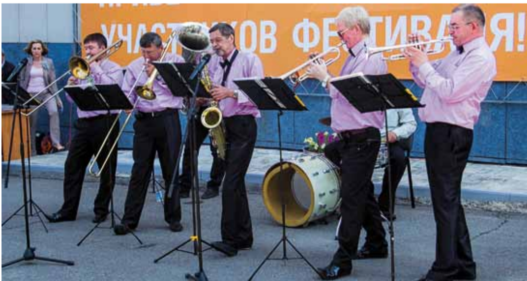
Живая музыка оркестра – на открытии фестиваля!

На фоне узкопрофессиональных номинаций выделялся конкурс, год назад вошедший в программу и набирающий всё большие обороты, – «Лучший молодой работник».