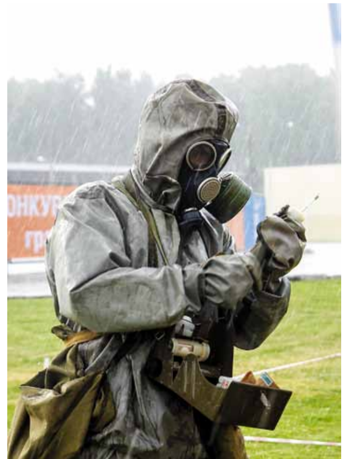
Гражданская оборона на промышленном объекте – это важно!