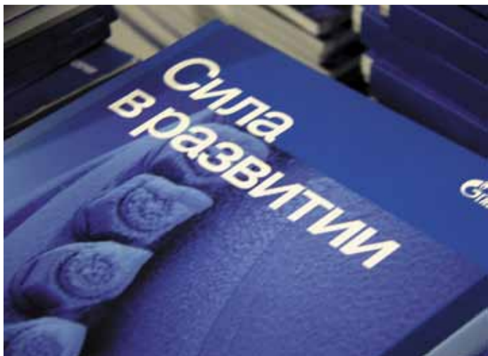
Итоги 2014 года показали, что Газпром уверенно смотрит в будущее