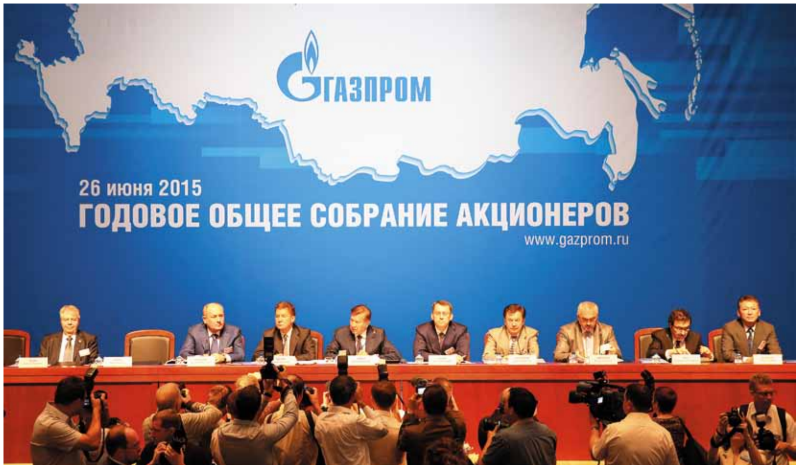
Общее собрание акционеров ОАО «Газпром» – важное событие года

Газпром продолжает демонстрировать динамичный рост финансовых показателей. Так,