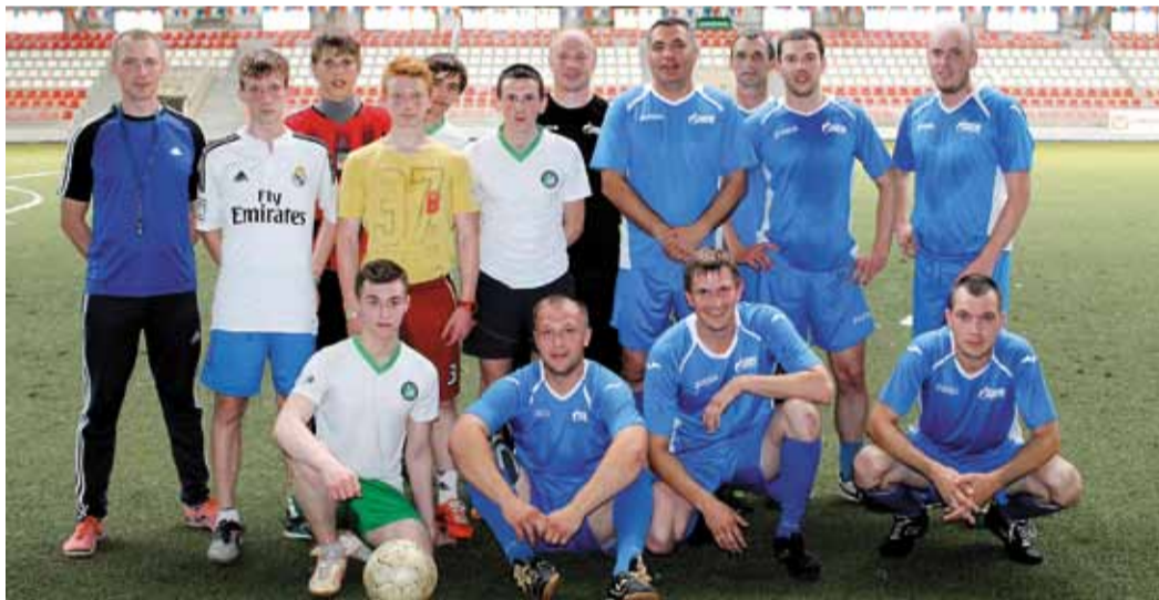
Футбол – игра для всех поколений

езд в город – это настоящий праздник! А коллективное посещение Театра драмы, со слов воспитателей, вообще состоялось впервые.