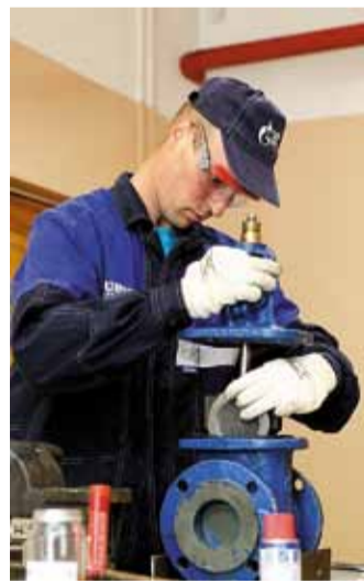
Соревнуются машинисты компрессорных установок