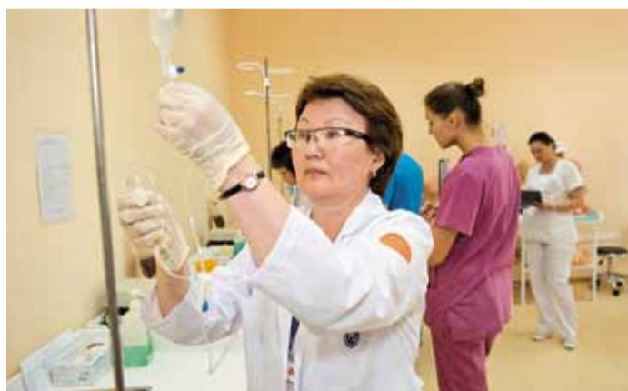
Знания медиков на уровне высоких стандартов