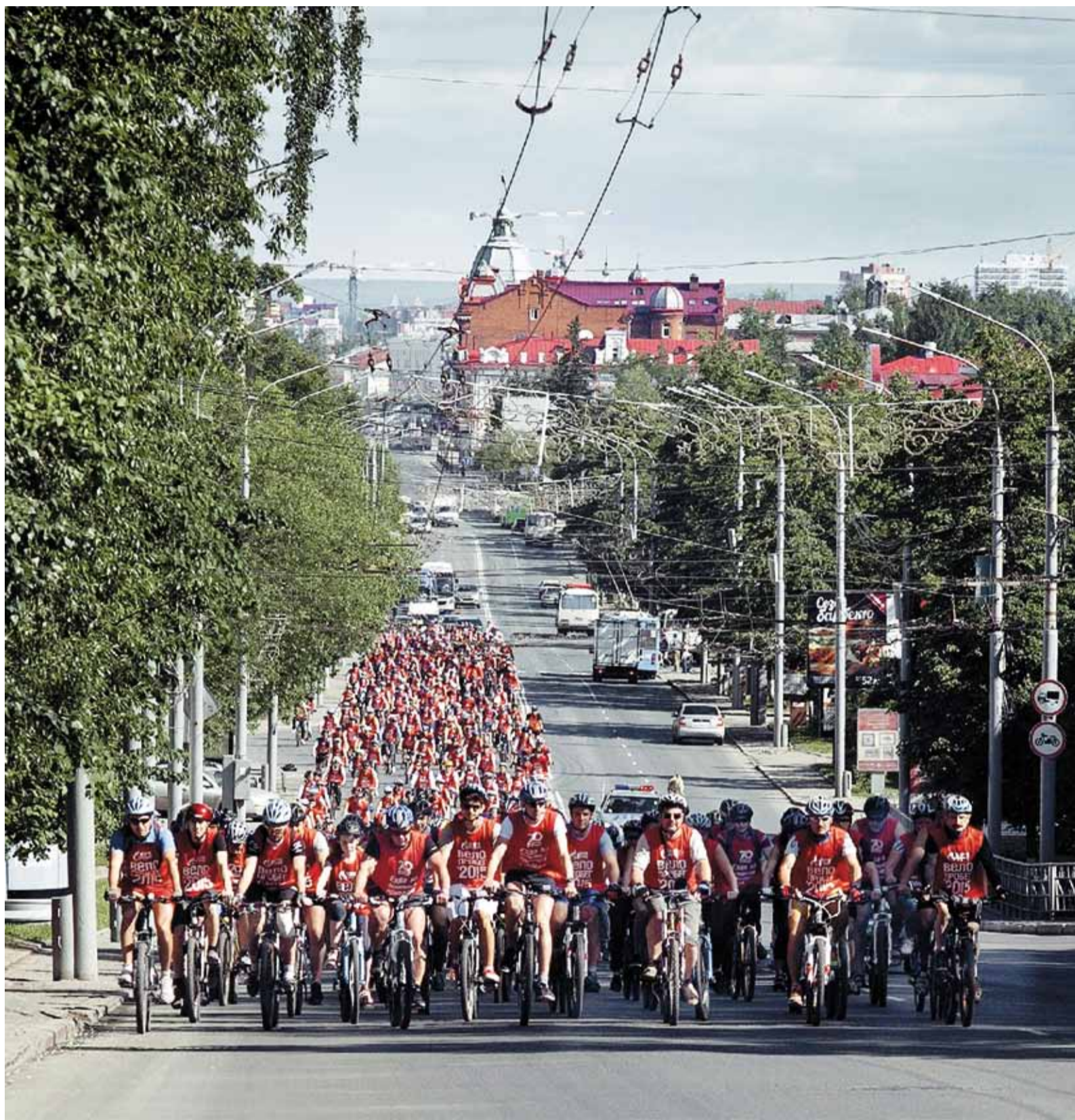
Пятый корпоративный велопробег. Колонна газовиков на центральной улице Томска