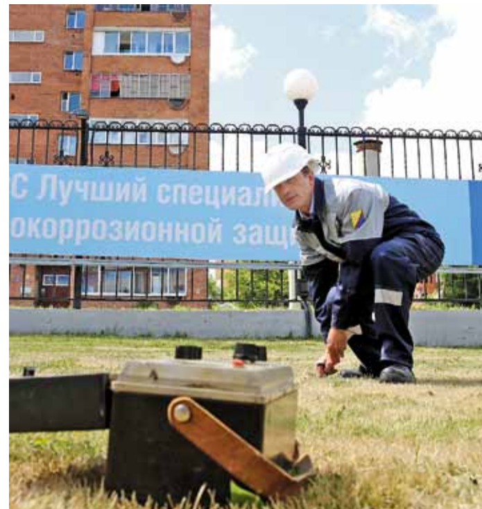
Конкурс специалиста ЭХЗ был максимально приближен к условиям трассы

Надо сказать, что первый этап конкурса начался, по сути, ещё в феврале, когда в филиалах приступили к определению самого достойного представителя своего коллектива из числа молодёжи. Оценка профессиональных и личностных качеств претендентов была всесторонней. В числе критериев – эффективность производственной деятельности работника, которую определяли с помощью коэффициента деловых качеств или коэффициента ответственности. Кроме того, учитывался результат рейтинговой оценки специалистов филиалов за 2014 год, количество благодарностей и почётных грамот. Также анализировалась активность молодого специалиста в научной деятельности: наличие учёной степени, участие в научно-практических конференциях, исследовательские публикации в корпоративных изданиях Газпрома и в изданиях Высшей аттестационной комиссии РФ. Важным фактором в определении лучших работников была их рационализаторская работа. Особенно высоко ценилась успешная патентная и изобретательская деятельность.