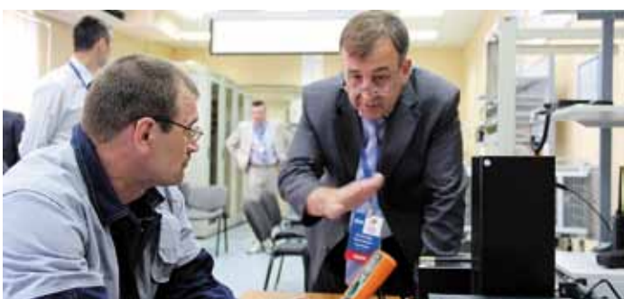
Специалисты службы связи соединяют пространство