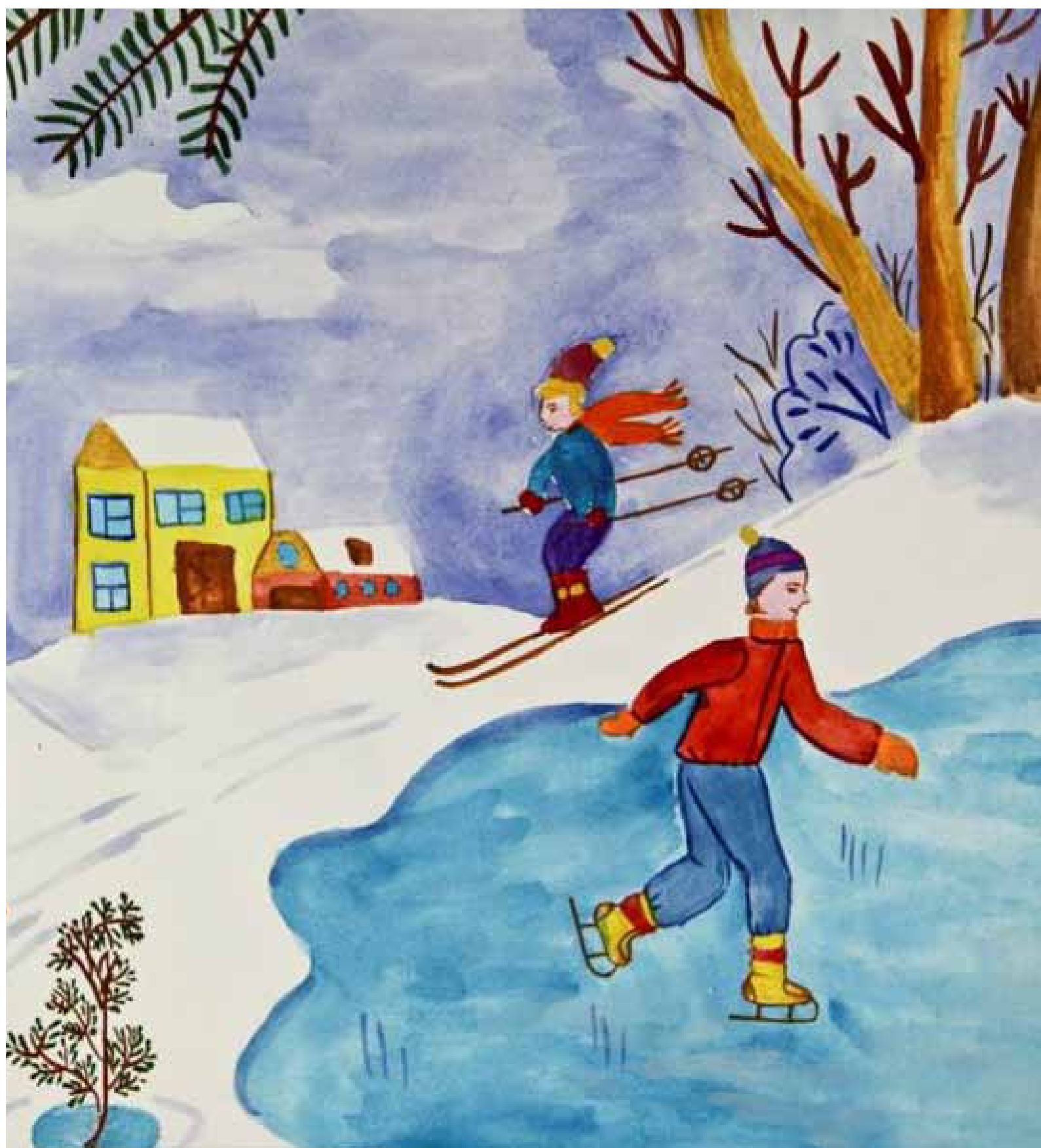
«Зимние каникулы», рисунок Галины Романовской из детского дома №3, г. Петропавловск-Камчатский