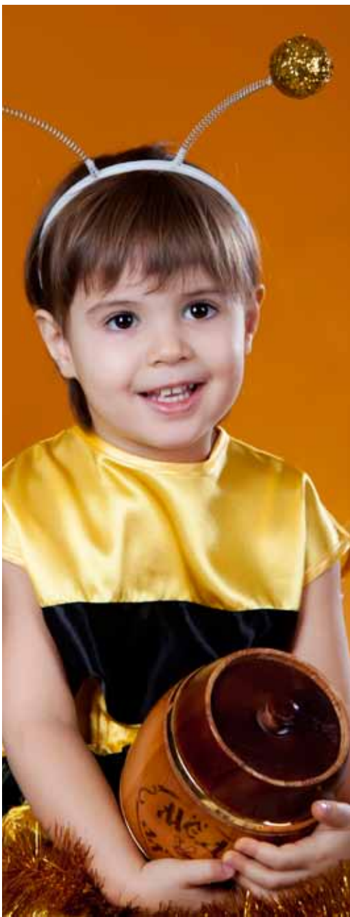
Лица Архитова – самая милая из всех пчёл