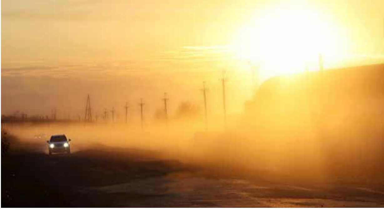
Снимок с окрестностями Барабинска покорила жюри конкурса «Смотри на мир шире»