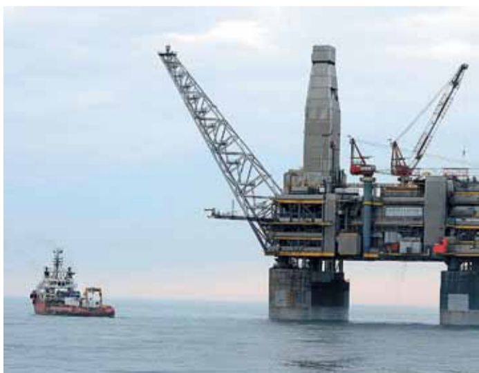
Сахалин – большие возможности и перспективы

Компания «Газпром трансгаз Томск» продолжает создавать условия для газификации юга Алтайского края. Ввод в эксплуатацию газопровода-отвода и ГРС в с. Нижняя Каянча будет способствовать решению проблемы энергодефицитности развивающихся особых экономических зон «Бирюзовая Катунь» и «Сибирская монета», а также позволит газифицировать прилегающие населенные пункты Алтайского края и Республики Алтай.