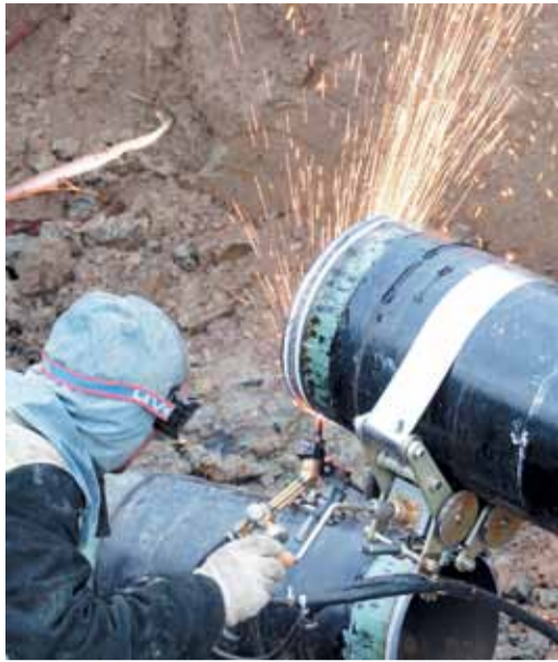
В работе сварщика важна не скорость, а качество

– Последние четыре года компания прошла как бы по своему летоисчислению: 2009 – Год охраны труда и промышленной безопасности, 2010 – Год экологии, 2011 – Год здоровья, 2012 – Год культуры. Какими событиями был насыщен последний?