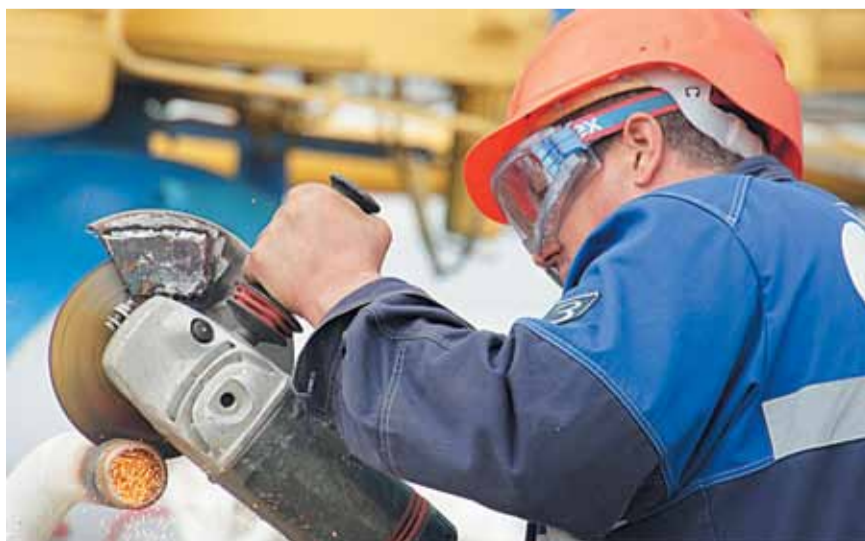
Профессиональное развитие коллектива – всегда главное направление в работе компании