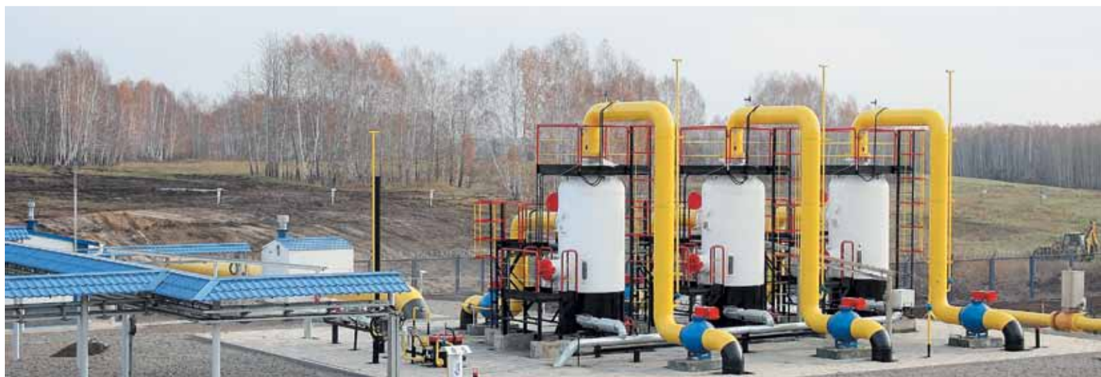
КС «Проскоково» после реконструкции

– Например, реконструкция под административное здание Александровского ЛПУМГ. Был