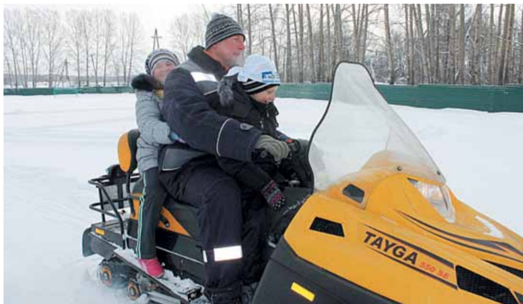
От желающих прокатиться на снегоходе не было отбоя!