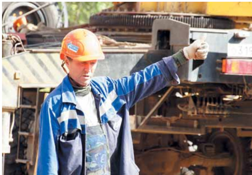
Модернизация линейной части газопроводов – залог безопасного транспорта газа

В перспективе протяженность газовых сетей в регионе планируется увеличить с 2,5 тыс. километров до 4,6 тыс. километров. К 2016 году на газ будет переведено более 104 тысяч домовладений (на 01.01.2011 – 54 825) и не менее 36 котельных. В итоге потребление газа в области с 2,1 млрд куб. м в 2010 году вырастет до 2,4 млрд в 2015-м. При этом резервы для дальнейшего роста останутся колоссальными: общая проектная пропускная способность магистральных газопроводов на территории Новосибирской области составляет более 22 млрд куб. м газа в год.