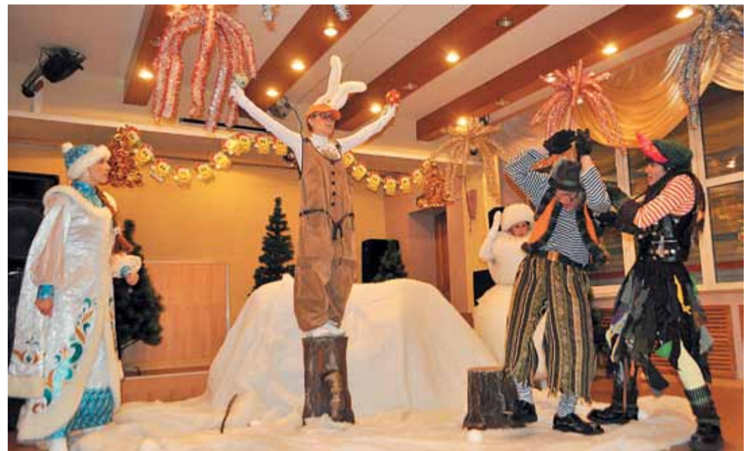
Спектакль «Снежная братва» — подарок детям Сахалина от газовиков из «Газпром трансгаз Томск»

Разве можно добровольно от этого отказаться? Жизнь тем и прекрасна, что бесконечно разнообразна. И Год культуры дал возможность каждому из нас эту свою индивидуальность проявить.