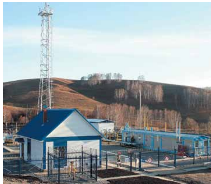
ГРС в Горно-Алтайске